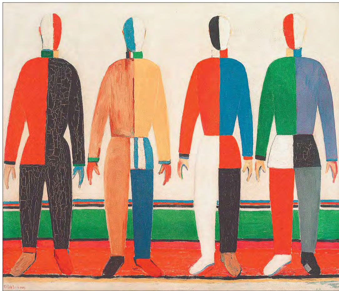
Das Bild Sportler des russischen Künstlers Kasimir Malewitsch , geboren 1878 und gestorben 1935, entstand zwischen 1928 und 1932. Es hängt heute im Staatlichen Russischen Museum in St. Petersburg

Heute ist 7-IT bereits auf 17 Mitglieder angewachsen, jedes Jahr kommen im Schnitt zwei neue hinzu. Die Genossenschaft ist für EDV-Fachleute besonders aus einem Grund attraktiv: Ein jeder bleibt Freiberufler, kann aber über die Kooperative auch große Aufträge annehmen, die ein Einzelkämpfer